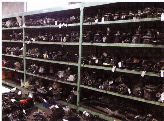
▲再生工程を終えて出荷待ちのリビルト部品