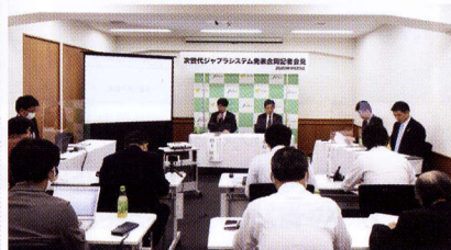
▲(株)JARA本社で開かれた記者会見の様様