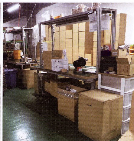
▲受注した部品を荷造りするカウンター。雰囲気は少し違う

自動車リサイクル部品の業界では次の時代への取り組みが進んでいるが、その中の一つが「リサイクル部品業者のリビルト部品への取り組み」である。リサイクル部品とリビルト部品は表面的には良く似ており、流通もさほどの格差は感じられないが、実は全くの別物で、その取り組みについては留意すべき点が少なくない。その留意点を探ってみた。