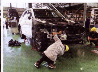
▲三洋商店での屋内研修会