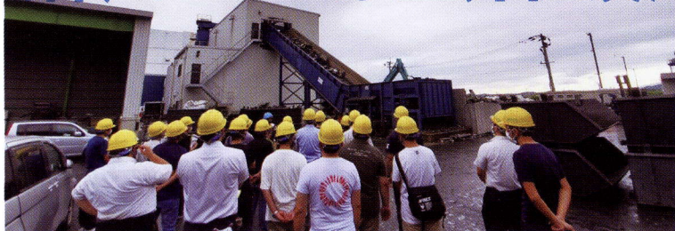
▲吉川金属商事鳥栖工場でのシュレッダー見学会